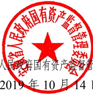
安徽省人民政府国有资产监督管理委员会