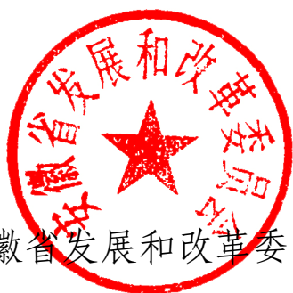
安徽省发展和改革委员会